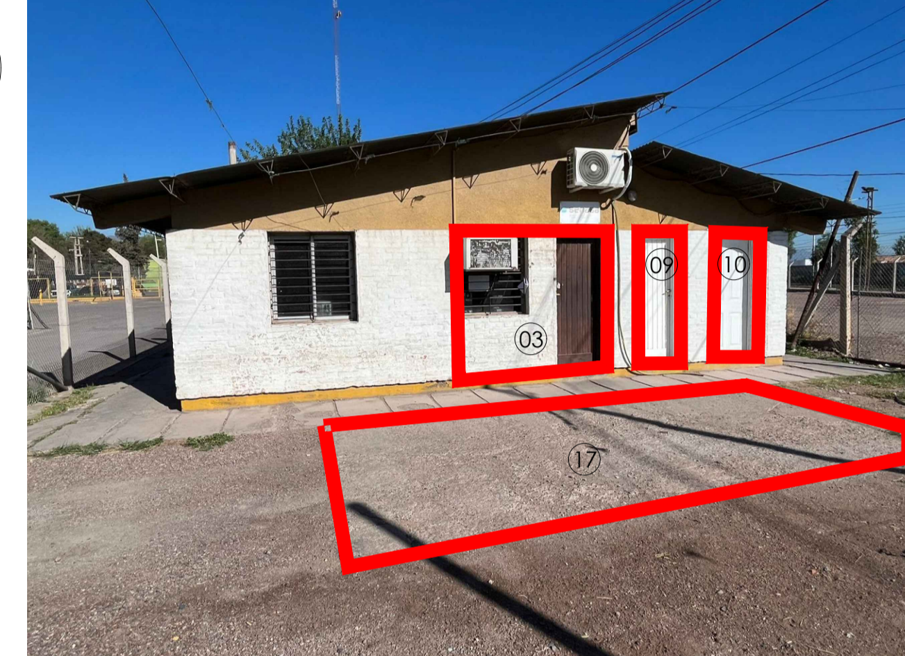
NOTA: PUERTA 09 Y 10 A RETIRAR SERÁN REUTILIZADAS EN ACCESOS PARA BAÑOS (SENASA Y PUERTO SECO)