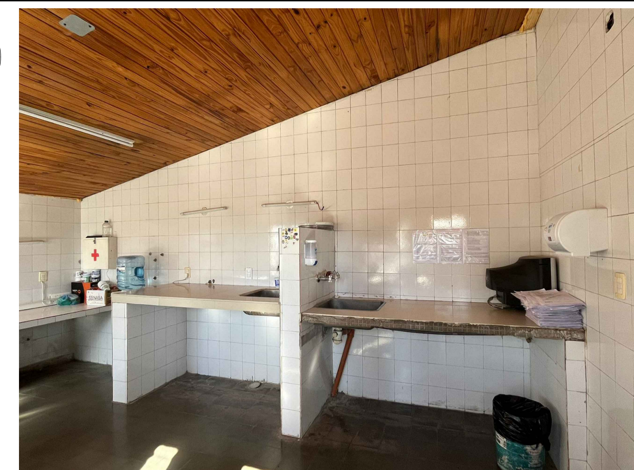
NOTA: MESADA OESTE : DEMOLICIÓN DE REVESTIMIENTO CERAMICO Y MESADA