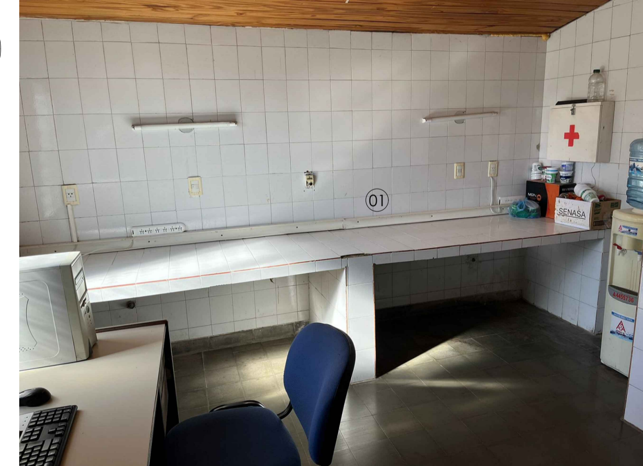
NOTA: MESADA SUR : SOLO DEMOLICIÓN DE REVESTIMIENTO CERAMICO